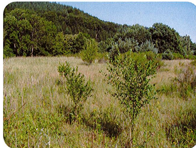
Vue de la prairie abandonnée d'Archettes

Depuis 2011, afin d'établir une protection pérenne du site, des acquisitions au profit de la Commune d'Archettes ou la signature de conventions sont négociées avec les propriétaires fonciers. A travers cette démarche, les différents partenaires s'engagent à maintenir l'équilibre écologique du site et à éviter sa dégradation.